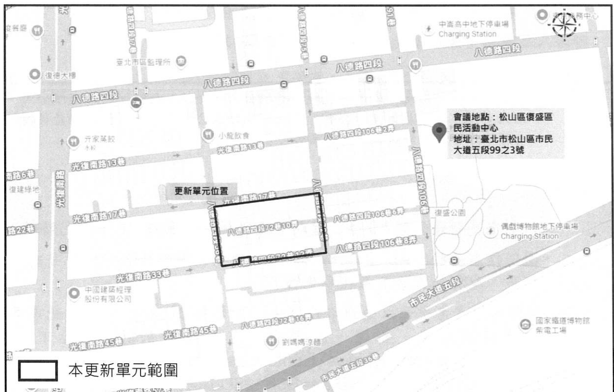
圖 2 開會地點示意圖