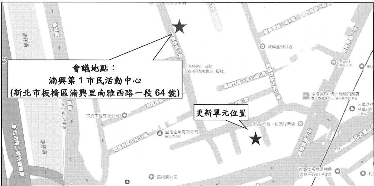
附件 2 開會地點位置示意圖